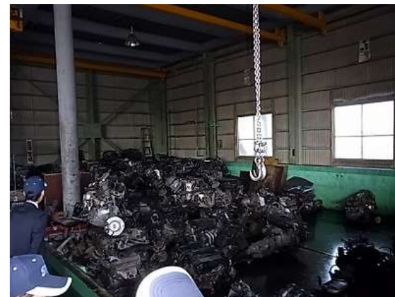
中古部品、清掃、ラッピング、仕掛品