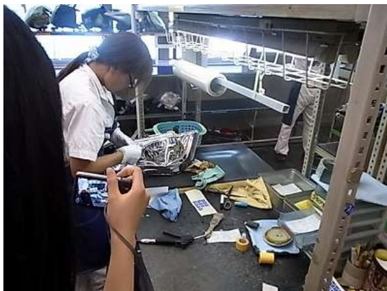
表面コーティング