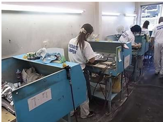
レンズユニット磨き場