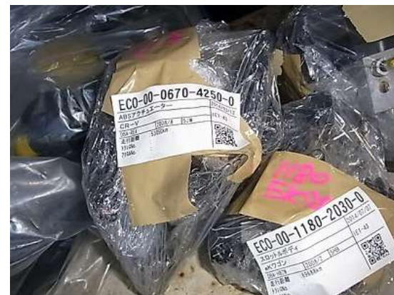
アクチュエーター スロットルボディ