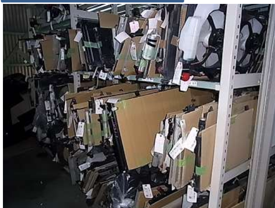
中古ラジエーター